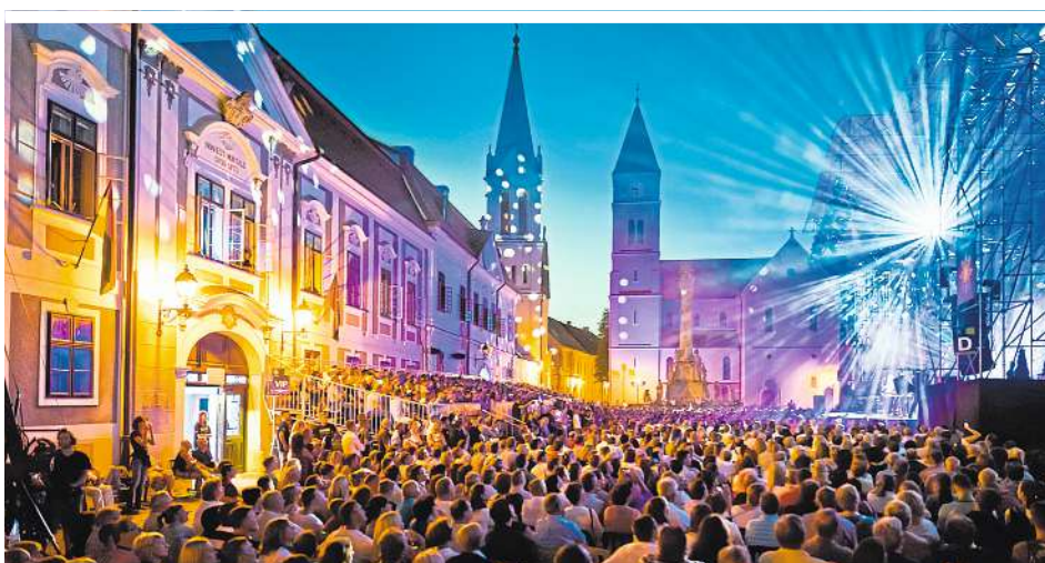
In Veszprém findet fast jeden Monat mindestens ein Musikfestival statt

Neben den geschichtlichen Hintergründen steht besonders das kulturelle Programm der Stadt im Vordergrund. Auf Besucher warten Klassik- und Pop-Konzerte, Theateraufführungen und Kunstausstellungen. Außerdem veranstaltet Veszprém fast jeden Monat mindes-