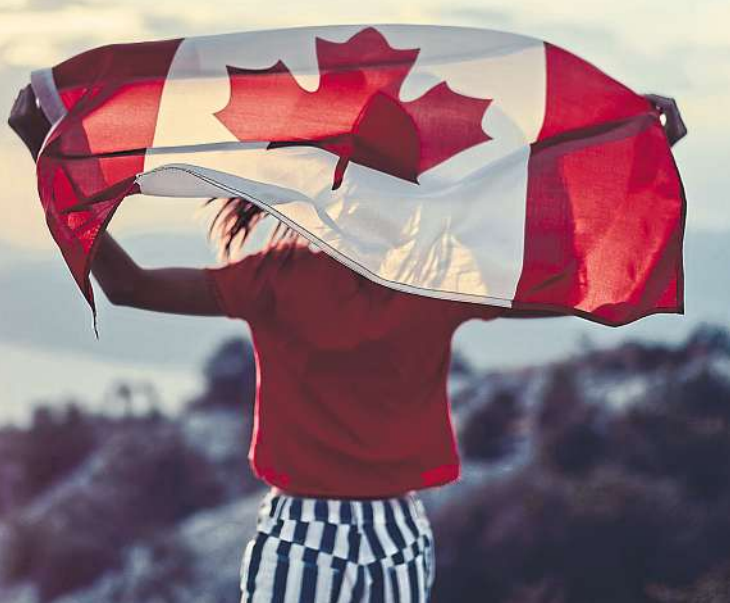
Die Hymne „Oh Canada“ gibt es auf Englisch, Französisch und Inuktitut

aus der Provinz Québec. Die Popsängerin hat 1988 den Grand Prix Eurovision de la Chanson gewonnen – für die Schweiz. Das klingt crazy. Die Crazy Canucks waren aber wiederum andere, nämlich die wilden Abfahrer des kanadischen Skiteams, die um 1980 den Österreichern um die Ohren führen. Ken Read oder Steve Podborski, um zwei zu nennen.